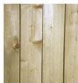
PIN DU NORD