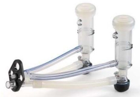
Classic Goats ITP205-SIM

Sammelstücke mit vollautomatischem Ventil, sowohl beim Melken als auch beim Reinigen. Sobald das Zitzengummi mit der Zitze in Berührung tritt, öffnet sich das Ventil. Sobald sich das Ventil wieder von der Zitze löst, erzeugt die einströmende Luft einen Unterdruck im Ventil, was dazu führt, dass das Ventil schliesst.