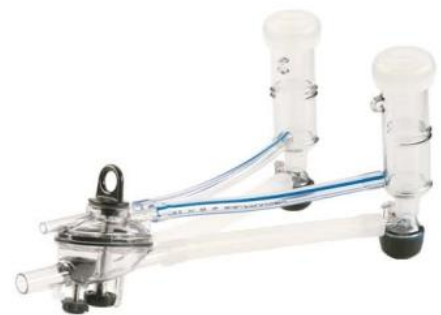
Vanguard Goats ITP205-SIM