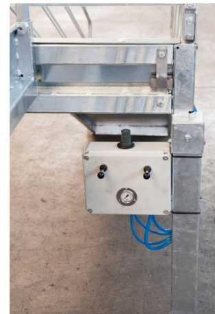
Pneumatik-Steuerung Commande pneumatique