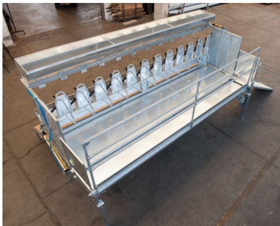
Pneumatischer Boden Plancher pneumatique