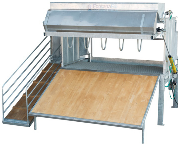
Schnellaustrieb mit Auslauf-Rampe Sortie en avant avec rampe descent

Salle de traite pour chèvres et brebis avec sortie en avant et placher pneumatiques